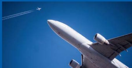
LUFT- UND RAUMFAHRT