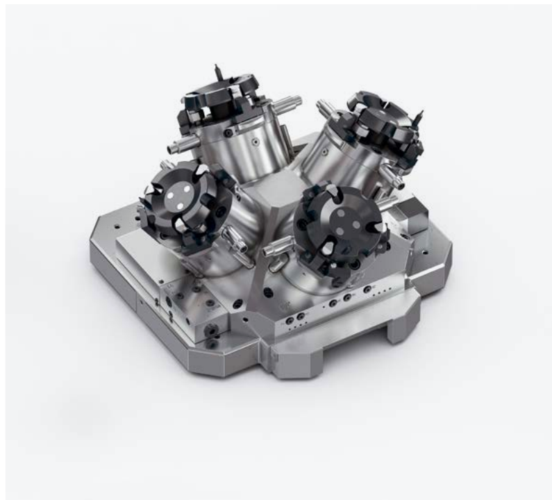
Beispiel für Mehrfachaufspannungen

Unsere technischen Berater sprechen anwendungsspezifische Empfehlungen aus für die Optimierung Ihrer Fertigungsschritte. So fahren Sie Hauptzeiten hoch und reduzieren unproduktive Nebenzeiten auf ein Minimum.