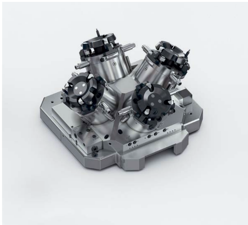
Példa több munkadarab egyidejű befogására

Műszaki tanácsadóink alkalmazásspecifikus ajánlásokat tesznek a gyártási lépések optimalizálására. Így Ön növeli a főidőket, és minimálisra csökkenti a nem termelékeny mellékidőket.