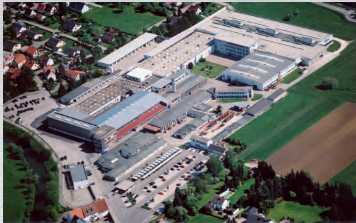
Produktion am Stammwerk Sontheim RÖHM GmbH Seit 1947