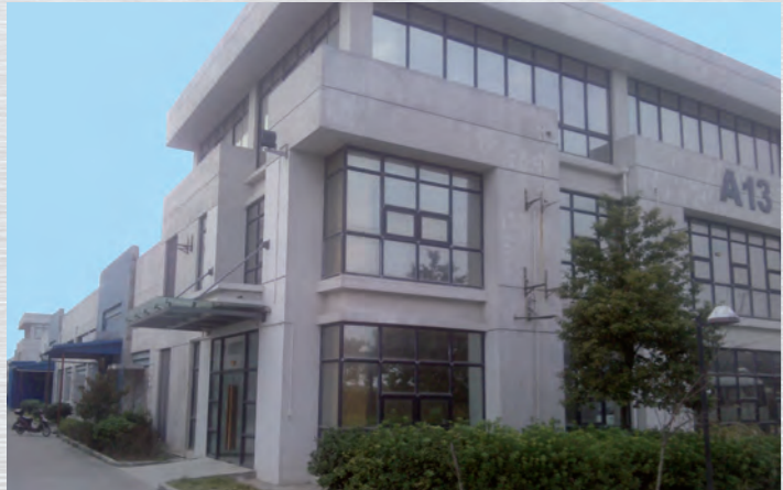
Montage in Shanghai RÖHM China Co., Ltd. Seit 2012