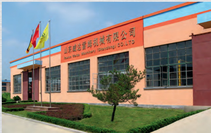
Produktion in Weihai / Shandong RÖHM WEIDA MACHINERY (JV) Seit 2006